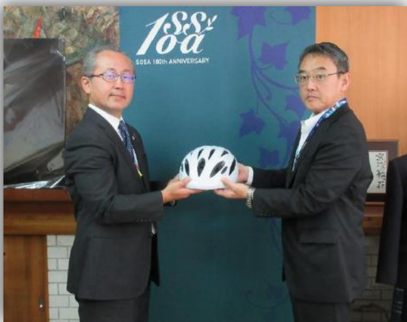
県教育委員会によるヘルメット贈呈

県教育委員会から、モデル校にヘルメット20個を支給し、ヘルメット着用推進に活用します。（支給したヘルメットは、秋山サイクル〔浦安市富士見〕から寄贈いただきました）