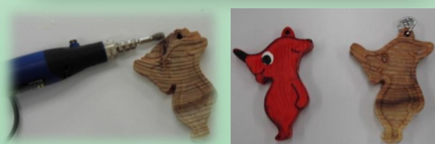
ルーターと呼ばれる機械を使って丁寧にバリ(角)を取ります。